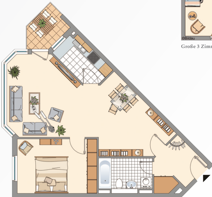
2 Räume - großzügig und hell