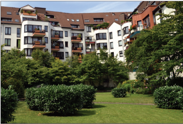
Da kommt man gerne Heim!

Mitten in der Stadt heißt natürlich auch moderne Begleiterscheinungen, die durch die hochwertige Bauausführung neutralisiert werden.