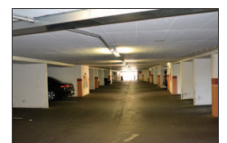
Helle hauseigene Tiefgarage

Auch wenn man das Auto in dieser optimalen Lage mit Anschluss an das öffentliche Verkehrssystem eigentlich nicht braucht, hat hier die aufwendige Parkplatzsuche im Veddel ein Ende in der hauseigenen Tiefgarage.