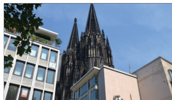
Der Kölner Dom

Der Dom und auch der Rhein mit der Altstadt sind nicht weit entfernt. Demnach zeichnet sich das Agnesviertel durch die zentrale Lage mit kurzen Wegen, dem pulsierenden Veddell mit Szenecharakter und dem grünen Umfeld aus.