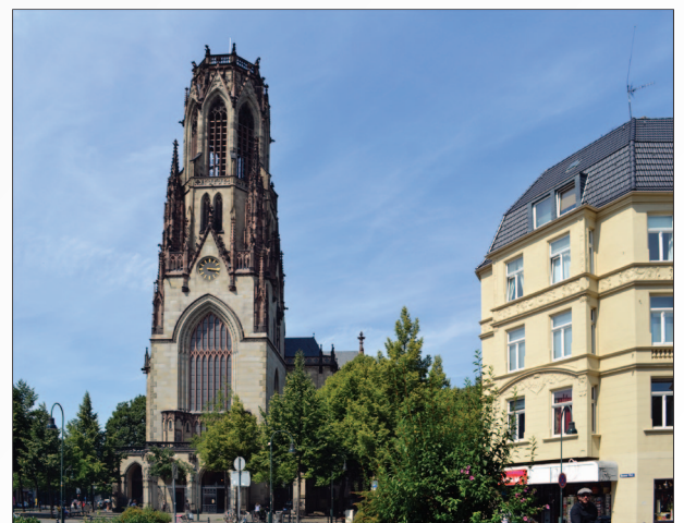
Im Zentrum des Veddels, die Agneskirche

Aber im Zentrum steht natürlich das Wahrzeichen; die Agneskirche und die historische Architektur der Umgebung die durch den nahe gelegenen Lis Böhle Park die grüne Ergänzung findet.