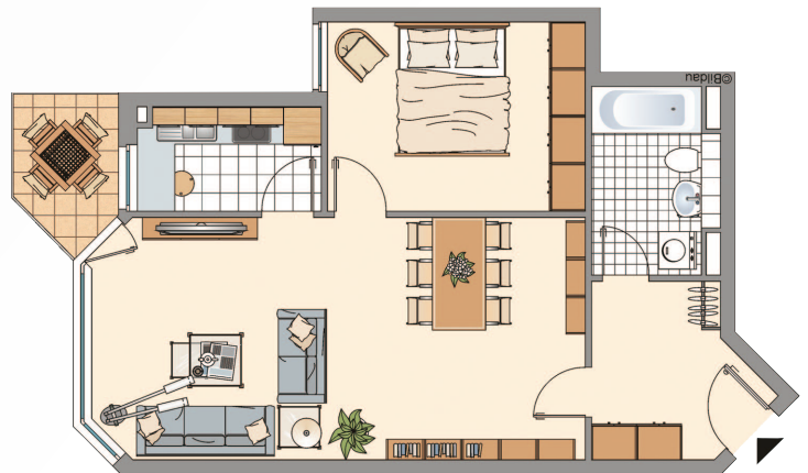
2 Räume mit allem Drum und Dran