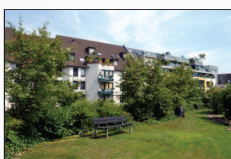
...und Ruhe im Innenhof

In insgesamt drei Bauabschnitten verwirklichte die Firma Bast Bau in den 90 ziger Jahren das Areal an der Inneren Kanalstr, Ecke Niehler und Neusserstraße in einer U Form.